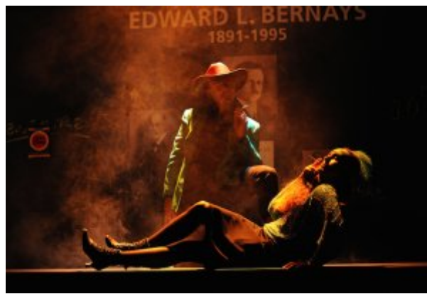
Un démocrate © Philippe Rocher