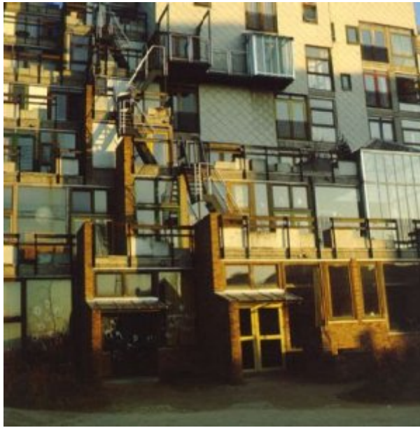
La mémé (Université catholique de Louvain) conçue par Lucien Kroll