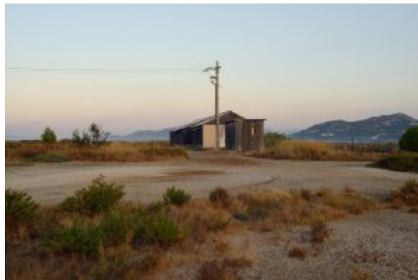
Ouvert dedans 2

Merci à la photographe CAROLINE DELMOTTE pour ses photos