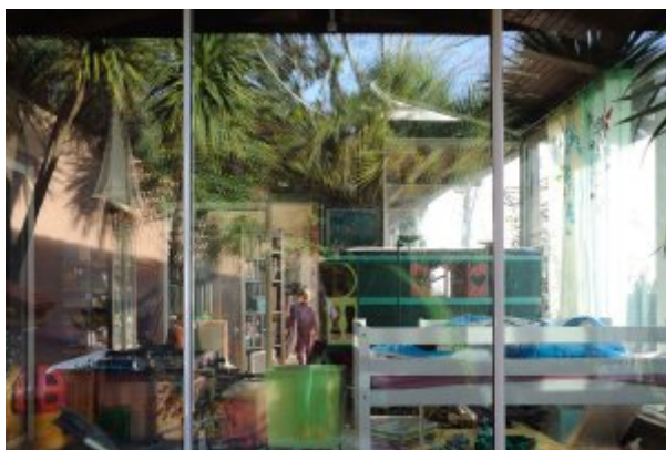
Matrix @ Caroline Delmotte

L'Art depuis le début du confinement n'est plus qu'une promesse. On dépose sur la toile des images et des sons soumis à l'oppression de la séparation, en gage de prochaines retrouvailles. C'est un moyen pour ne pas se perdre totalement, résister à l'engloutissement. L'Art devient aussi vital que l'eau, le feu, l'air et la terre, il devient nécessaire. Mais il n'est plus une expérience collective partagée ou très peu. Il est en cage, comme les bêtes sauvages derrière les grilles ou les vitres d'un zoo, il ne peut plus mordre, mais il peut fertiliser, éveiller, réveiller.