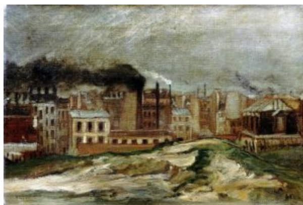
Paysages d'Usines de Théophile Alexandre Steilen (1859-1923)

Pour comprendre les systèmes de valeurs dépréciatifs, déployés pour appréhender les arts en banlieues, il faut bien saisir le long processus de segmentation territoriale et sociale qui a, de fil en aiguille, amené l'émergence de ce qu'on nomme risiblement « les banlieues chaudes ». Au Moyen-Âge, les territoires qui constituent des formes de proto-banlieues consistent en zones [2] séparant la ville de la campagne sur lesquels seigneurs et abbés exercent un droit de « ban », à savoir l'imposition d'une forme de redevance. Ces zones servent avant tout à moudre le grain dans des moulins et le peu d'habitants travaillent notamment à la fortification des remparts. Des foyers de peuplement finiront par émerger au niveau des faubourgs, notamment pour s'extirper du paiement de l'octroi, au grand dam du pouvoir central qui va alors tenter, sans trop de succès, de limiter l'implantation dans ces zones. Parallèlement à cela, au XIXe siècle, les faubourgs vont progressivement nourrir l'intérêt d'un certain nombre d'artistes et d'intellectuels citadins excédés par la vie urbaine centrale. Face à une ville de plus en plus miséreuse, le mouvement romantique trouvera un pied-à-terre idéal en banlieues et va se développer pour faire de celles-ci un vaste jardin contre la monotonie et l'austérité de l'industrialisation.