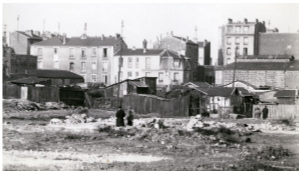
Vue panoramique sur la Zone vers la Porte de Clignancourt, au loin, la ville de Saint-Ouen (vers 1940)

Des coupe-gorges ouvriers, on passe aux banlieues d'après-guerre comme espace de relégation pour les travailleurs immigrés précaires. La transformation des banlieues populaires comme terre d'installation de facto pour les immigrés les plus pauvres va consolider l'image de zones encore plus chaotiques. Il faut ajouter à cela un malaise grandissant des conditions de vie qui se dégradent : isolation phonique et thermique absente, espaces non entretenus et surtout, une présence policière de plus en plus brutale. Dans l'espace médiatique, on entend de plus en plus parler de criminalité, d'escalades de violence, de dénonciations d'errements moraux qui étaient déjà pointés du doigt lors de la première phase de prolétarisation des banlieues. Quoiqu'il en soit, dans les imaginaires collectifs, une dualité bien précise s'installe : Paris et son lustre sophistiqué et prestigieux, sa couronne populaire et sa corruption.