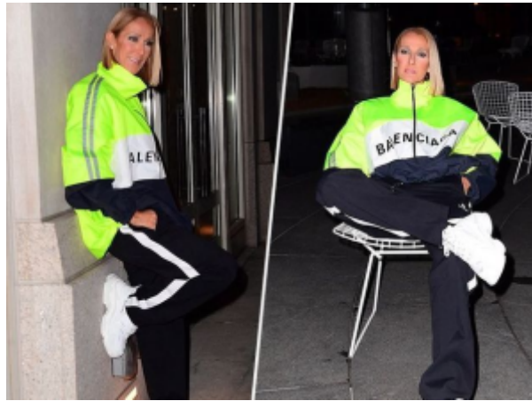
Khey Céline Dion en jogging Balenciaga en février 2020 : de l'embourgeoisement du streetwear

Cependant, ce n'est pas parce qu'on adopte superficiellement des habits qu'on comprend les sens qui les irriguent. Ce n'est pas parce qu'on prend connaissance des sentiments de jeunes pauvres en colère qu'on les assimile. Malgré son plébiscite, le rap n'en est pas moins délégitimé. Je pense notamment à la mini-polémique que Trax Magazine a provoqué en mettant Jul en couverture de son numéro de février 2020. Jul est une figure clivante au sein de la scène rap : certains louent sa productivité, sa spontanéité et sa créativité, d'autres débinent la faiblesse et la simplicité de ses textes et instrumentaux. Qu'on l'aime ou non n'est pas la question. Ce qui retient l'attention, c'est la disqualification fréquente dont fait l'objet Jul. On ne prend pas la peine d'apprécier sa musique parce qu'on a déjà une idée précise de ce qu'elle est, à savoir ridicule et inutile, alors que d'autres artistes plus ou moins équivalents bénéficient de grâces plus clémentes.