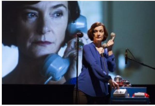
Blanche-Neige... La Cordonnerie

La salle rit. J'ai l'impression d'être au cirque. Ce nain qui explose nous éloigne de Bettelheim et de ses explications sur le rôle des petits êtres sans âge dont la vie est « une interminable ronde laborieuse ». Changement radical de point de vue. Blanche-Neige nous fera partager le sien. Un film défile sous nos yeux. Nous la verrons grandir, la belle-mère vieillir légèrement et le mur s'écrouler. Nous sommes à la fin de l'été 1989, au dernier étage de la plus grande tour du « Royaume » (une cité HLM à l'orée d'un bois). Élisabeth, une femme d'une quarantaine d'années, élève seule sa belle-fille Blanche. Elle est hôtesse de l'air mais ne s'envoie pas beaucoup en l'air. Elle est assez distante voire rigide. Femme bafouée, frustrée ? Blanche est une très belle adolescente de 15 ans au look gothique, mutique et écorchée vive : sa mère est morte quand elle était enfant et son père, un fameux trapéziste, est parti depuis des années travailler dans un cirque en URSS. La vie à deux n'est pas simple. Au fil des années, un mur s'est construit entre Blanche et Élisabeth. Et à 2000 kilomètres de là, Berlin est coupée en deux.