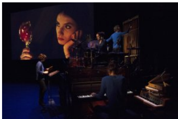
Blanche-Neige... La Cordonnerie

À la sortie nous sommes tous quatre aussi enjoués qu'à l'arrivée. Quatre spectateurs aux interprétations différentes, qui n'ont pas porté leur attention sur les mêmes choses. Autant de spectateurs et de ressentis que d'interprétations. J'échange quelques mots avec des amis de la troupe amateur. L'échange n'ira pas au-delà. Sur le chemin du retour, on parle à bâtons rompus de ce qu'on a vu. Je crois que c'est la première fois qu'un spectacle fait l'unanimité entre nous. Je ne sais pas vraiment ce qu'en ont retenu Lola ou Victoria ni ce qu'elles ont réellement ressenti. Mais ce fut un moment de vie puissant et débordant.