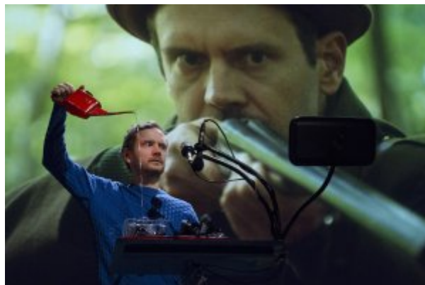
Blanche-Neige... La Cordonnerie © Sébastien Dumas

Avec cette réécriture de Blanche-Neige , La Cordonnerie mêle l'histoire intime des héroïnes à la Grande Histoire, mondiale, universelle. Le spectacle bouscule quelques certitudes inscrites dans l'imaginaire collectif : La belle-mère du conte n'est pas la méchante narcissique qu'on croit connaître, Blanche-Neige n'est pas la gentille fille naïve dont on parle. Les nains n'habitent pas dans une maisonnette dans la forêt, la pomme empoisonnée n'est pas un sombre plan ourdi par la marâtre pour se débarrasser de sa belle-fille. Le « ciné spectacle » est la marque de fabrique de La Cordonnerie. Détournement de contes ou de mythes pour les insérer dans le réel.