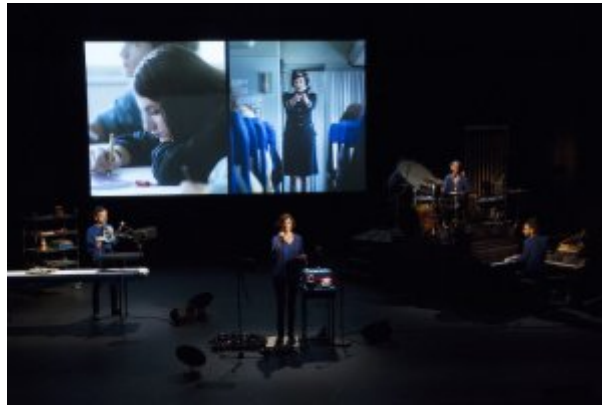
Blanche-Neige... La Cordonnerie