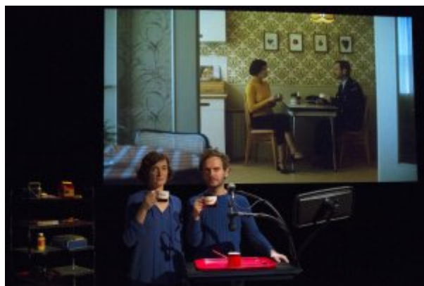
Blanche-Neige... La Cordonnerie