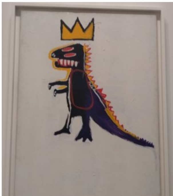
Pez dispenser J-M Basquiat - Fondation Vuitton

des jours après. Ébahis, séduits, secoués. Nous partons avec chacun un petit bagage ou pas pour pénétrer le temple aux multiples facettes de verre, Vuitton Land. Je sais pas mal de choses sur « Jean-Michel » comme disent les aficionados. Mes connaissances remontent à mes cours d'arts plastiques du lycée quand je m'éclatais à mettre de grands aplats de peinture sur les toiles immenses avec les copains !