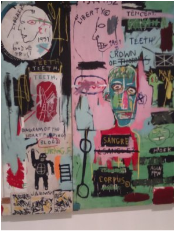
In Italian Basquiat à la Fondation Vuitton