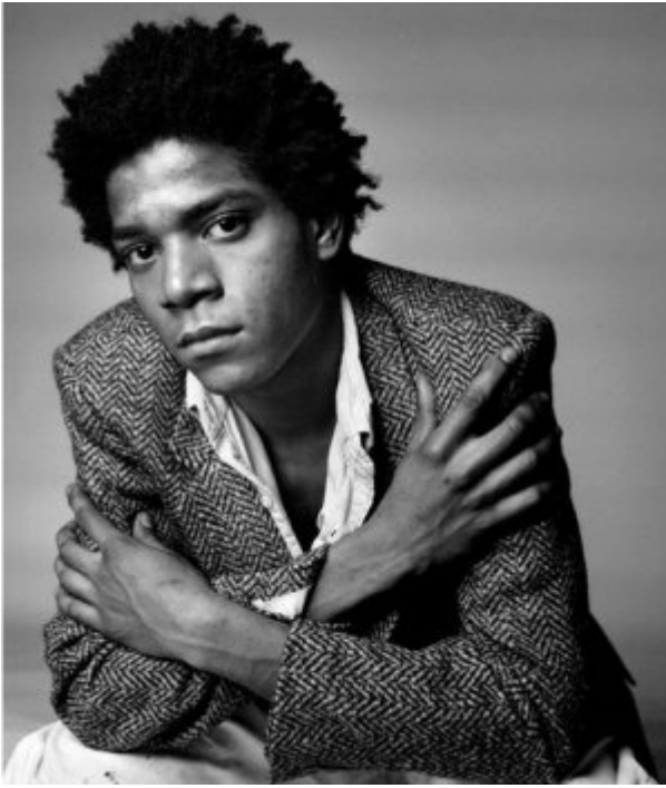
Jean-Michel Basquiat Paris Chanel.