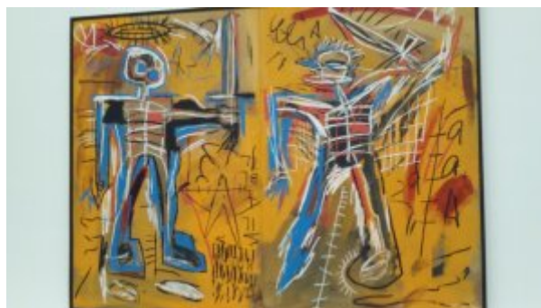
Offensive orange Basquiat Fondation Vuitton