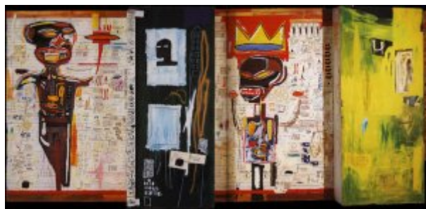
Jean-Michel Basquiat à la Fondation Vuitton