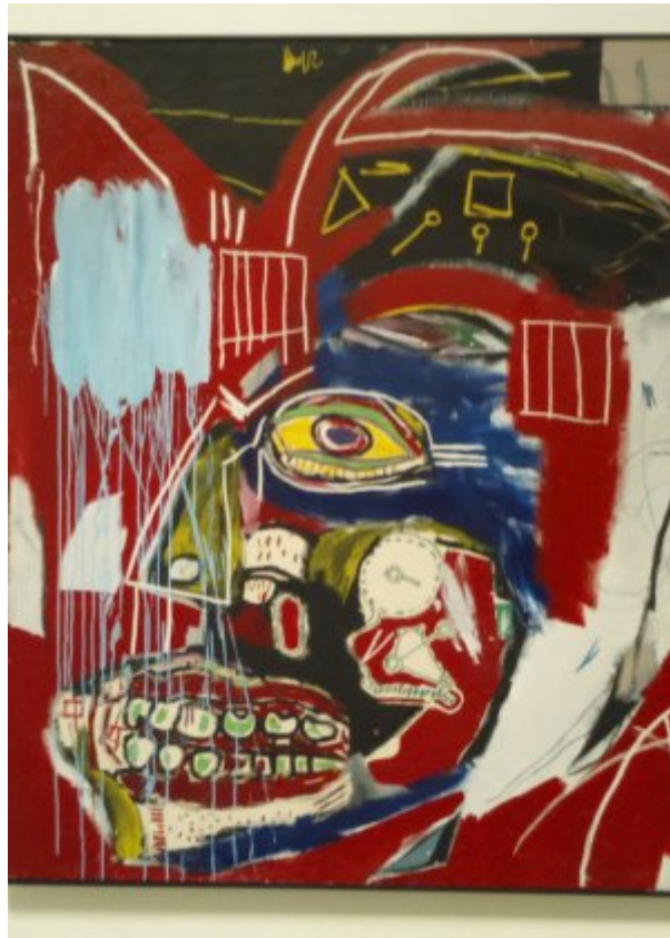
Autoportrait sans nom Basquiat Fond. Vuitton