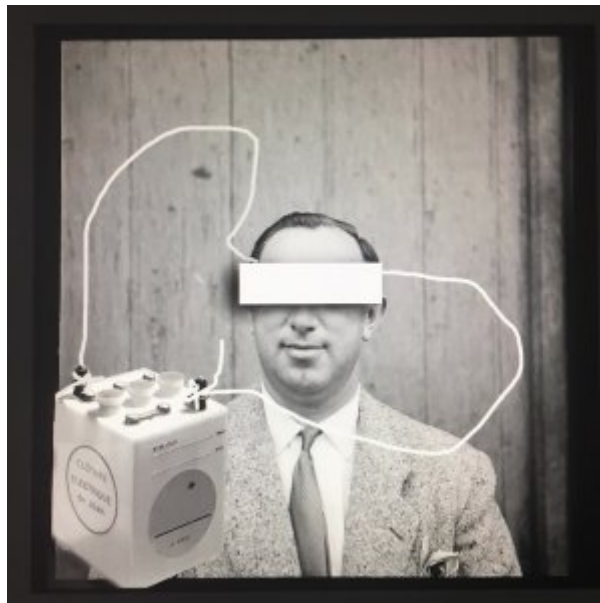
Les 3 rêves de Maurice © Olivier Perrot

Parent1 : « Il faut vivre avec son temps maman, à force ça devient dangereux pour nos enfants ! Ne nous en veuille pas, mais puisque tu t'obstines, on a décidé de ne plus te les confier. Ils sont inscrits à la garderie numérique, désolé. »