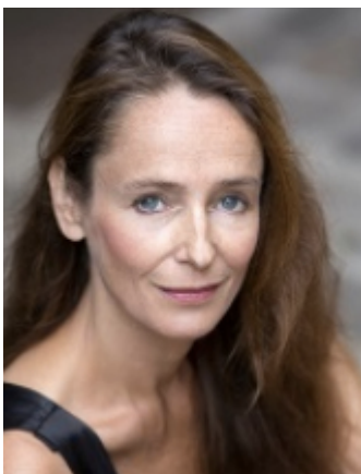
Juliette Mailhé © DR