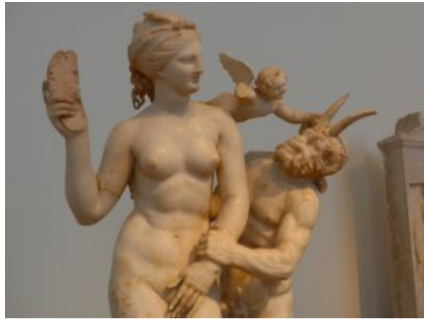
Nymphe talochant Pan - Musée d'archéologie national

Le jeune Achille parle polonais, sa langue paternelle ; le grec est sa langue maternelle ; il s'exprime en français avec ses camarades de lycée à Lyon, et vient d'être reçu avec mention au baccalauréat à quelques jours de ses 18 ans.