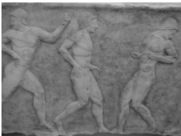
Ephèbes effectuant des exercices sportifs - mur de Thémistocle - Musée d'archéologie national

Mercredi 15 juillet, 11h, place Monastiraki , un livreur derrière sa camionnette en stationnement provisoire crie très fort parce qu'une femme au volant de sa petite voiture a klaxonné, sans doute pour lui signifier qu'il bloque la circulation. Comme à Paris c'est les soldes. La femme se hâte à deux pas de là vers les attractions d'une grande rue piétonne (peu importe laquelle puisque c'est la même rue piétonne partout), la camionnette qui encombre la chaussée a ralenti sa course vers les magasins, et les quelques coups de klaxons envoyés par l'impatiente au volant de sa voiture rouge n'ont certainement pas envisagé cette riposte.