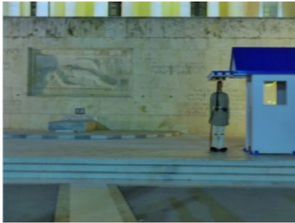
20h30 parvis du parlement place Syntagma

Ce matin du mercredi 15 juillet , place Syntagma, aucune trace de la manifestation de l'avant-veille hormis quelques banderoles tendues entre les arbres. Le choix tragique du premier ministre Alexis Tsipras n'émeut pas la circulation automobile sur le boulevard séparant la place en deux par le va-et-vient des innombrables taxis jaunes.