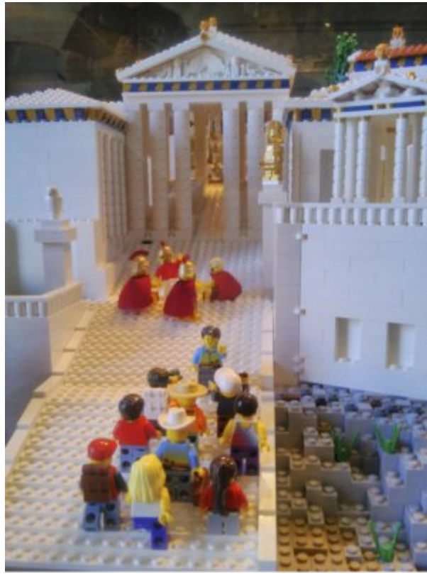
Maquette Lego de l'Acropole exposée au musée de l'Acropole

La marque Lego™ en quête de nouveautés ludiques et lucratives propose une acropole en kit à construire et à détruire. Un prototype est exposé au musée de l'Acropole. (C'est l'antiquité la plus photographiée de la visite.)