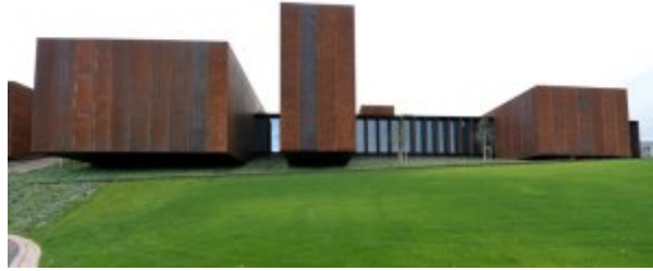
Musée Soulages © Jean-louis Bories

Je m'en vais vous conter en quoi Soulages me fascine.