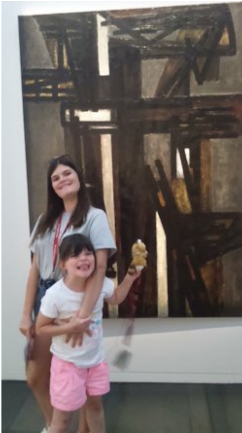
Soulages et les filles