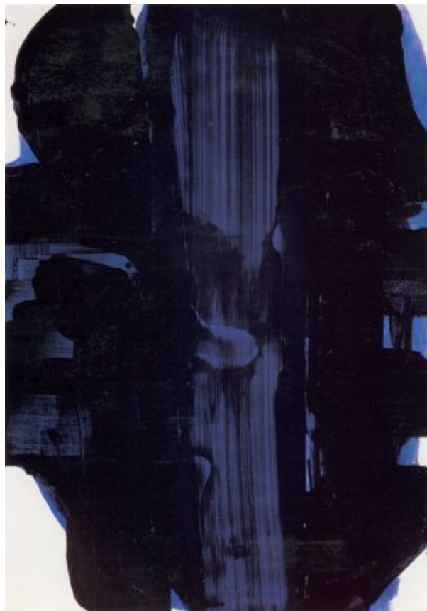
Peinture 202x143cm 30 novembre 1967 cat n612 © Bernard Bonnefon

L'Outrenoir n'est pas une dénomination crâne, c'est un néologisme né de la sérendipité [2] comme souvent chez lui. C'est en 1979, lors d'une période de doute et de découragement devant une toile, qu'il dit se trouver « dans les marécages du noir ». Il décide d'aller se reposer et après quelques heures découvre que cette matière est malléable, qu'elle se métamorphose. Le noir est devenu réflecteur de lumière. Sur la surface du tableau, la lumière joue par reflets et anime toute la matière peinte. Elle accentue traces, passages, enlèvements et morsures d'outils. L'action de la lumière fait définitivement échapper à la monochromie du noir unique. L'outrenoir : au-delà du noir. S'ouvre alors un autre champ mental.