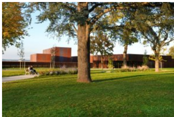
Musée Soulages

Ce n'est pas pas cette exposition qui me meut. C'est la découverte de son œuvre, de sa vie et de sa démarche, lors de la visite de son musée à Rodez en août dernier. J'imaginai un artiste au discours abscons muré dans une tour d'ivoire, inaccessible, sombre. Un cliché de l'art abstrait. Un artiste pour initiés. Il n'en est rien. Pierre Soulages est terrien, affable, curieux. Sa puissance vitale est éblouissante. Cette exposition dans le salon carré du Louvre, je lui fais la nique. Crainte de perdre l'enchantement ? En contrepartie, je lance une invitation pour partager mon émoi lors de la découverte de son musée et de son œuvre en pays de Rouergue. En arrivant à Rodez on découvre un long socle duquel émergent cinq volumes d'acier rouge corrodé. Voici le musée Soulages. Un immense jeu de cubes rouillés avec de grandes vitres qui donnent sur les paysages de l'Aubrac. Il a accepté de voir s'élever un musée à son nom à ces conditions : un musée Soulages oui, mais uniquement s'il participait à sa création et si d'autres artistes y étaient exposés. Un vrai lieu de vie et non un mausolée. Mission réussie.