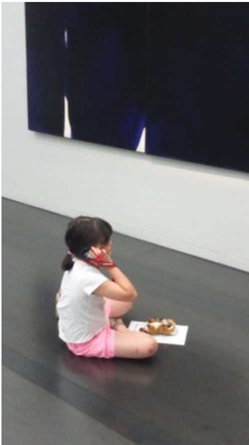
Lola et Soulages

Je veux vous réconcilier avec le noir des ténèbres. Le noir n'est pas seulement la couleur du deuil, ou du luxe, de l'austérité ou de la tempérance. Fréquenter Soulages peut provoquer un élan vital. Pierre Soulages délaisse la perfection. Il aime les traces, les fêlures, les détours, les débordements, les gouttes de peinture qui font tâche. Il revendique le dépassement des lignes. La faute devient géniale. C'est un inventeur acharné. La plupart de ses outils de travail sont des objets détournés : un balai, une brosse, des couteaux à enduire, des semelles de chaussures. Il creuse, sculpte, gratte. Il ne donne aucune leçon d'interprétation. Ses tableaux ne portent pas de nom mais des numéros et leurs dimensions. Désarçonnant ? Plutôt une invitation à se raconter sa propre histoire. Regardons plus loin et pas uniquement avec en tête la symbolique du noir. Si, pour Chevreul, le noir est une non-couleur, pour Michel Pastoureau le noir fait parler la couleur. Chez Soulages le noir émet la lumière.