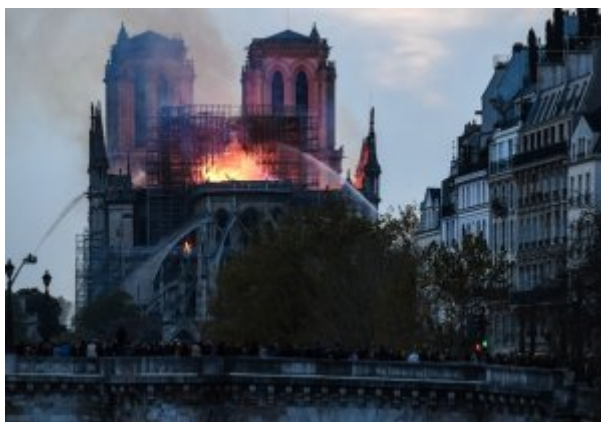
ND de Paris le 16 avril

Esthétiquement, cet incendie est un événement magique . NDP paraissait invulnérable, éternelle. Le grand incendie, capable de détruire les édifices les plus solides, est un mythe venu du passé. Néron et Rome. La filmographie américaine qui pullule de Tours infernales vouées aux flammes ambiguës, purificatrices et diaboliques. Londres 1666. Les grands édifices de pierre et de bois brûlent communément. Ici, le drame, hautement spectaculaire comme dirait Guy Debord, se déroule dans un magnifique jardin, au milieu de la ville-lumière, dans un somptueux décor formé par l'île de la Cité, les bras de la Seine qui entourent, comme un écrin liquide, le berceau en flamme. Une émotion maternelle, portée par une puissante iconographie médiévale.