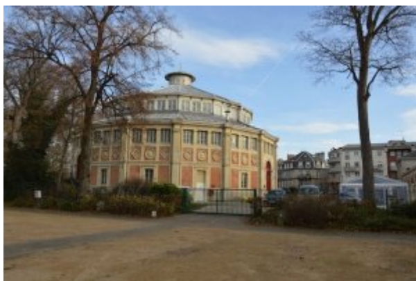
Le Manège de Reims

À mon inhibition sensorielle s'ajoute le fait d'avoir côtoyé des artistes. Comment se positionner pour écrire sans une certaine bienveillance ? Eh bien il m'a fallu laisser du temps au temps. Voici l'évolution de l'état de la patiente-spectatrice, moi-même, une fois « purgée » par les Bacchantes. Et encore, ce n'était qu'un prélude !