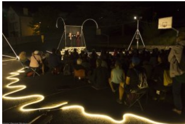
Delices DADA Les 4 saisons Aurillac 2018

Parler d'enfance, de naïveté, est une erreur due à la difficulté de démêler les fils contraires dont le tissage produit cette ambiance étrange, cette atmosphère difficile à décrire, ce plaisir si contrasté. Du coup, le spectacle fonctionne comme une leçon de théâtre, mais sans didactisme. La structure typique du théâtre de rue, faire glisser un espace social déterminé dans un autre sans obéissance à la règle topologique de leur cloisonnement, est ici montrée à l'état natif.