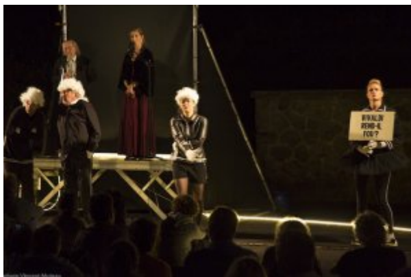
Delices DADA Les 4 saisons Aurillac 2018

Les 4 saisons de Délices Dada met en crise les notions habituelles qui permettent d'interpréter les spectacles et les objets esthétiques. La naïveté, notion réflexive liée à son contraire, est à peu près impossible dans un festival de rue où l'opération critique est un principe structurant pour le travail créatif et l'effort du spectateur. Il n'y a pas de premier degré.