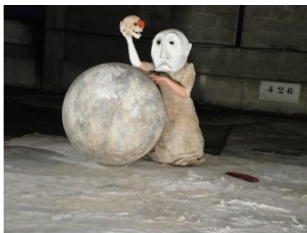
Scélérat (2014) par Méga Pobec

Je viens d'accepter un défi. J'en tremble un peu. Je n'ai jamais fait ça. Enfin... Pas comme ça. Écrire ? Plus encore : tenir une chronique régulière sur L'Insatiable, qui propose une démarche d'exploration et de débats sur l'art et la société, « l'art comme principe actif ».