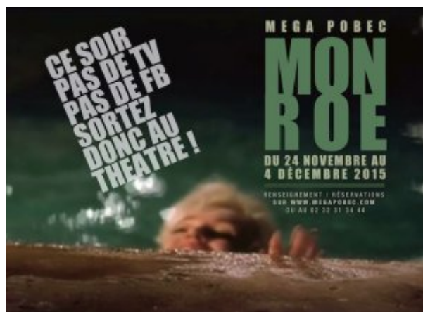
Monroe Frédéric Vossier/Méga Pobec (2015)

Une histoire où la démarche artistique était le principe actif et le levier d'épanouissement des territoires et des imaginaires de la vie sociale. Des histoires comme la mienne, comme la nôtre, il y en a eu tant qui s'évanouissent, s'effacent peu à peu des mémoires.